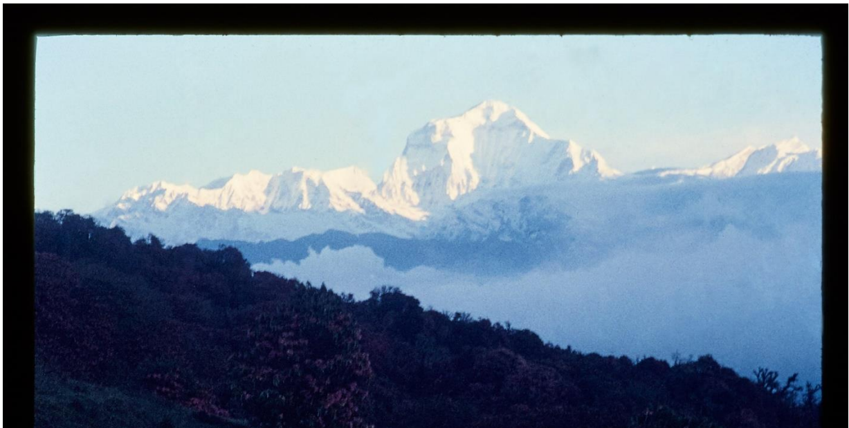
Quand les « Géants » de l'Himalaya se dévoilent.

Debout de bonne heure, nous entamons une longue montée jusqu'à Sarangkot. C'est un chemin probablement plus dur que la route classique mais il promet un panorama fantastique. Au bout d'une heure, on doit renoncer. L'une des filles est malade handicapée par une diarrhée sévère. Nous redescendons. Le lendemain, alors que nous parlons de repartir, j'ai à mon tour des crampes d'estomac. Rattrapé par la fièvre et torturé par la diarrhée pendant 24h00. C'est seulement 4 jours plus tard que nous reprenons l'escalade mais cette fois par la route facile c'est à dire sans vue en fond de vallée. Le moral des troupes en a pris un coup. À Naudanda, le premier village où nous nous arrêtons, la pluie nous rattrape. Mais peu avant que le soleil se couche, le ciel se dégage complètement et pour la première fois le « Machapuchare » et moi nous trouvons face à face. Cette arête gigantesque ou contour parfait me domine du haut de ces 6993 m. Sommet vierge, encore jamais conquis. Je me sens tout petit au pied de cette muraille, mais récompensé de ces heures de marche.